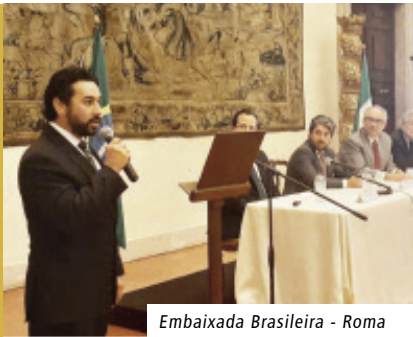
Embaixada Brasileira - Roma