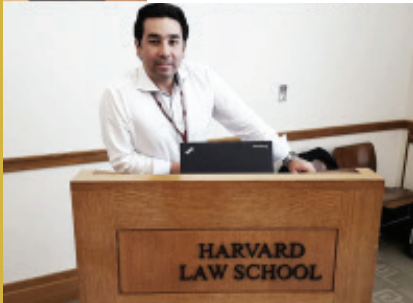
Harvard Law School - Cambridge