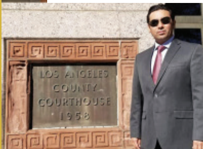
Corte Superior da Califórnia - Los Angeles